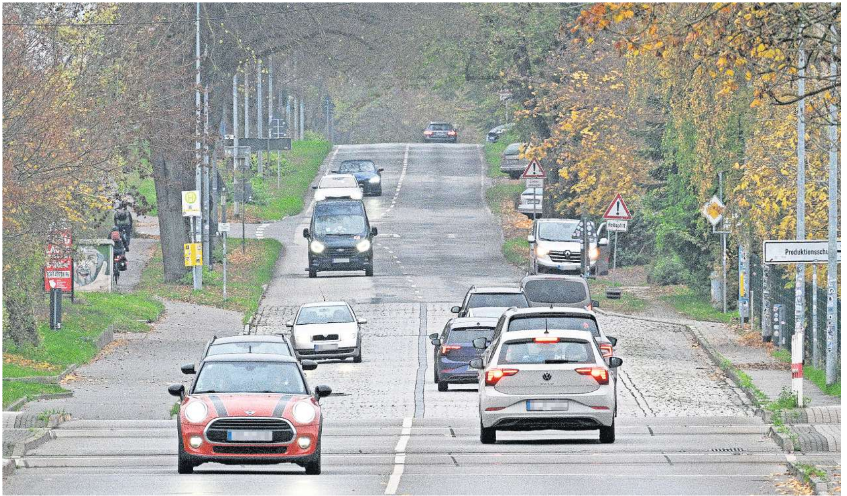
Blick auf die Neubrandenburger Straße in Rostock. Die Straße soll nun in mehreren Abschnitten saniert werden. Das hat auch gravierende Auswirkungen.